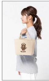
33.ランチトートバッグ(きなり) ¥500